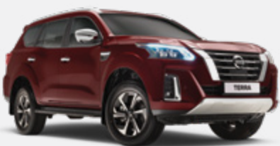
Vermelho Escuro - NAW