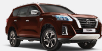
Castanho - CAU