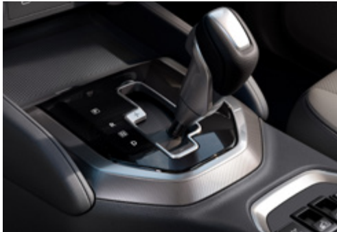
CAIXA DE VELOCIDADE INTEGRADA

Experimente o máximo torque e eficiência no 2.5ℓ DDTI Intercooled Turbo Diesel Engine. Combinado com uma caixa automática de 7 velocidades ou uma caixa manual de 6 velocidades, terá toda a potência e todo o controlo para uma experiência de condução emocionante.