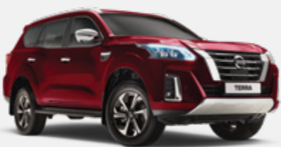
Vermelho S - AX6