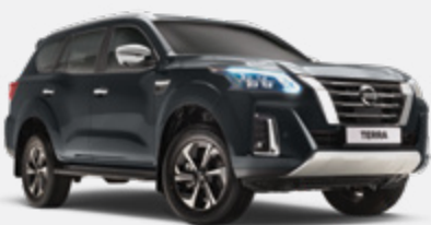
Cinzento - K21