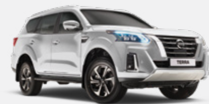
Branco P - QX1