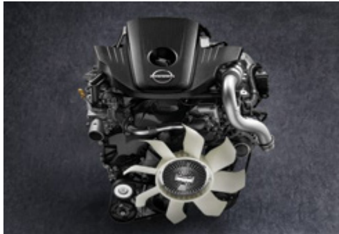
2.5ℓ DDTI INTERCOOLED MOTOR TURBO DIESEL

Quer seja trânsito na hora de ponta ou chuva torrencial, conte com, eficiência e segurança de que precisa para o fazer passar confortavelmente.