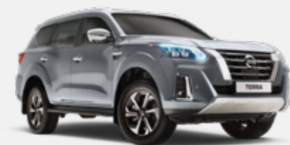
Prata - K23